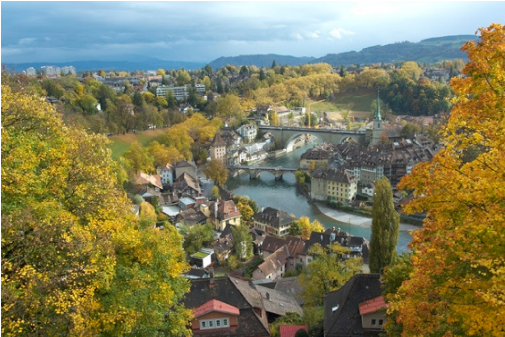
Aussicht aus dem Raum F102